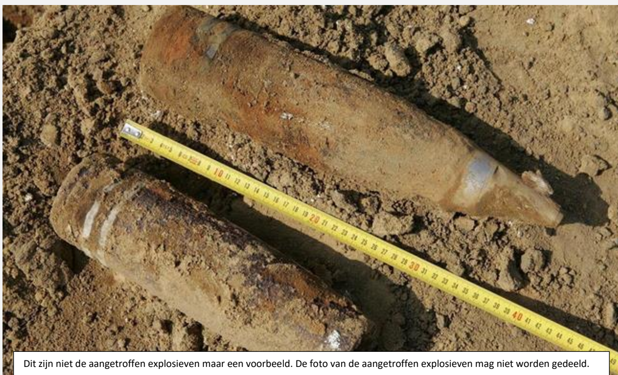
FOTO 1 – VOORBEELD VAN AANGETROFFEN VERDACHTE EXPLOSIEF (VERPLAATST DOOR DE EOD)

Dit zijn niet de aangetroffen explosieven maar een voorbeeld. De foto van de aangetroffen explosieven mag niet worden gedeeld.